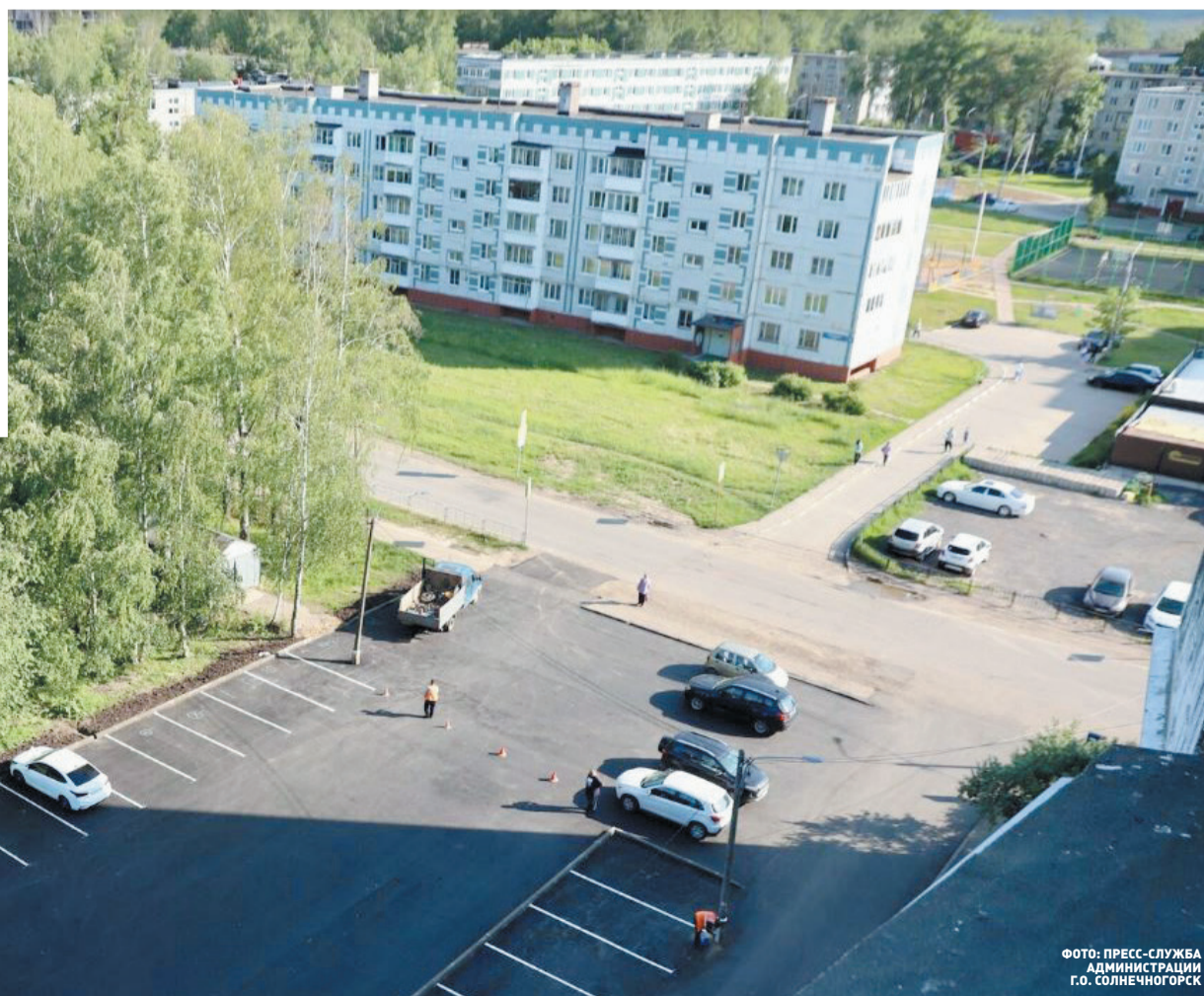
У дома № 50 по улице Обуховская дополнительно разместили более десяти парковочных мест, теперь их стало 70