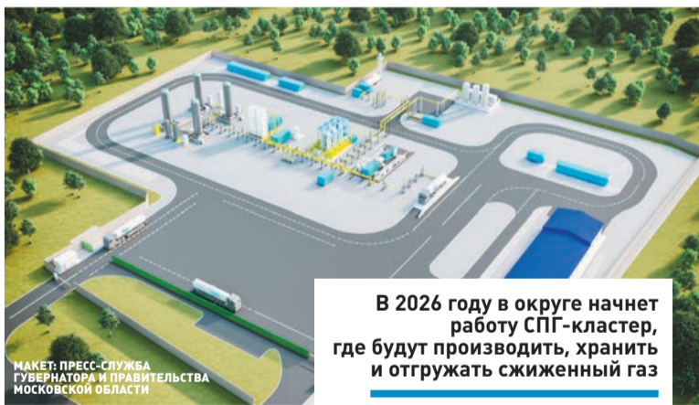
В 2026 году в округе начнет работу СПГ-кластер, где будут производить, хранить и отгружать сжиженный газ