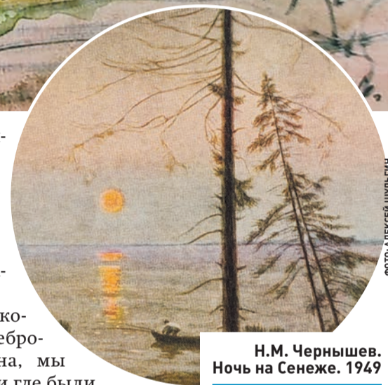
Н.М. Чернышев. Ночь на Сенеже. 1949

А я, как сорок лет назад, приезжая в Подсолнечную, что, казалось бы, мог еще