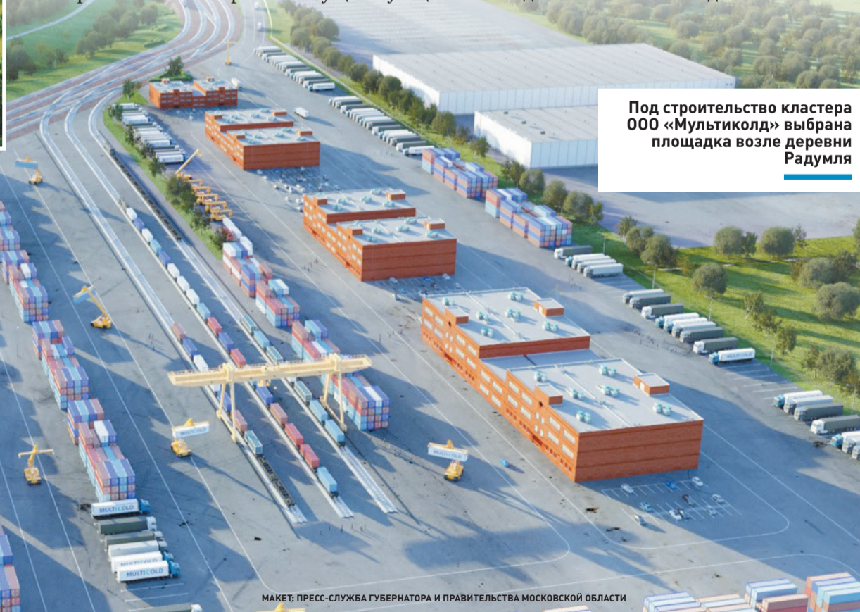
Под строительство кластера ООО «Мультиколд» выбрана площадка возле деревни Радумля