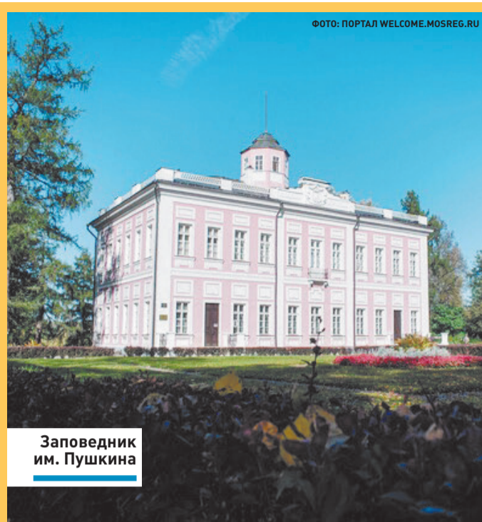
Заповедник им. Пушкина

тилетий была местом, где собирались самые видные и значимые люди своего времени. Одним из ее владельцев в XIX веке был писатель Сергей Аксаков. В гости к нему приезжали Иван Тургенев, Михаил Загоскин, Федор Тютчев, Николай Гоголь. Последний, кстати, часто гостил в имении и там написал второй том «Мертвых душ», которой позже уничтожил. Во второй половине XIX века в гости к другому владельцу – меценату и промышленнику Савве Мамонтову приез-